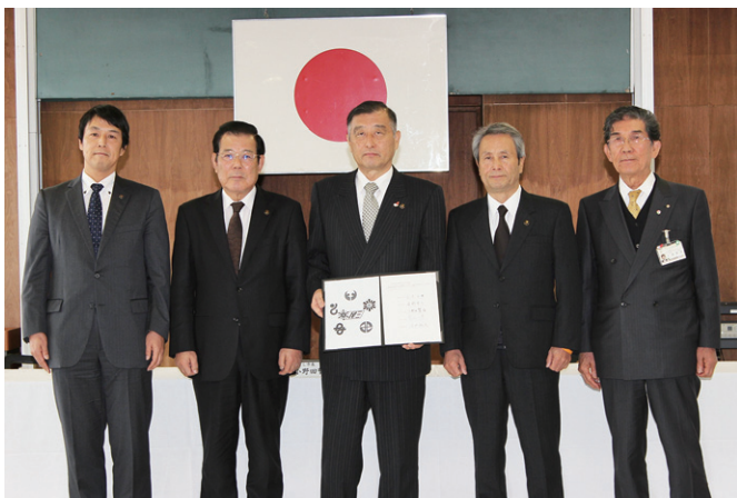
4市1町の首長による広域化合意の調印

その後、広域化開始に向け具体的事務を進め、平成30年4月1日から運用を開始しました。